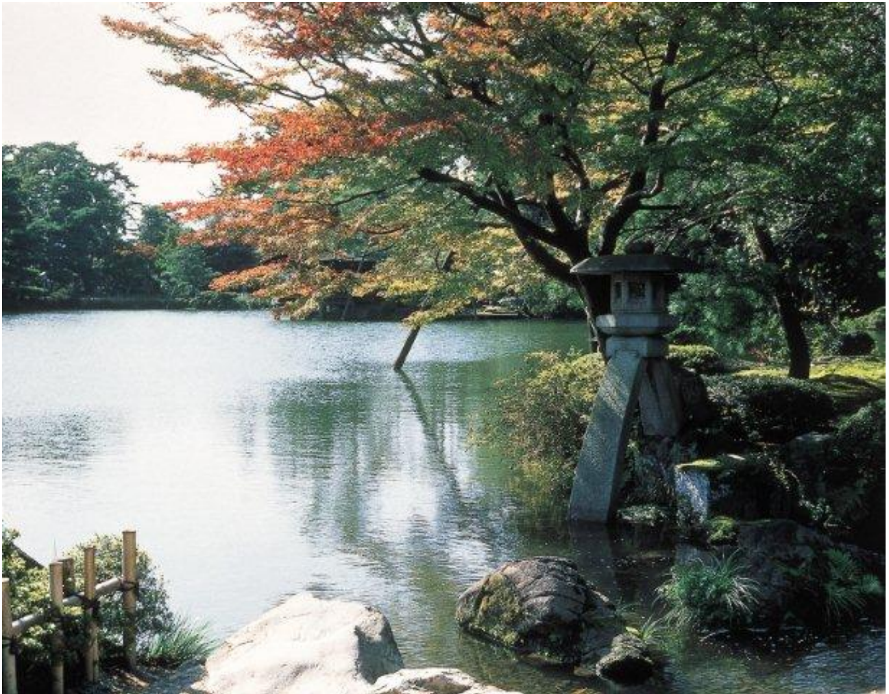
兼六園 ことじ灯籠 (石川県金沢)