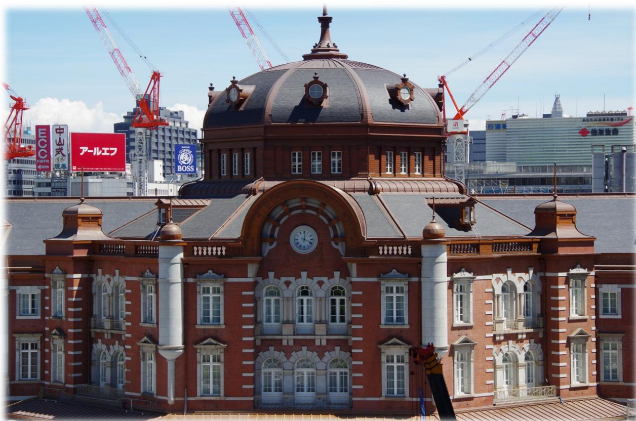
改修された東京駅