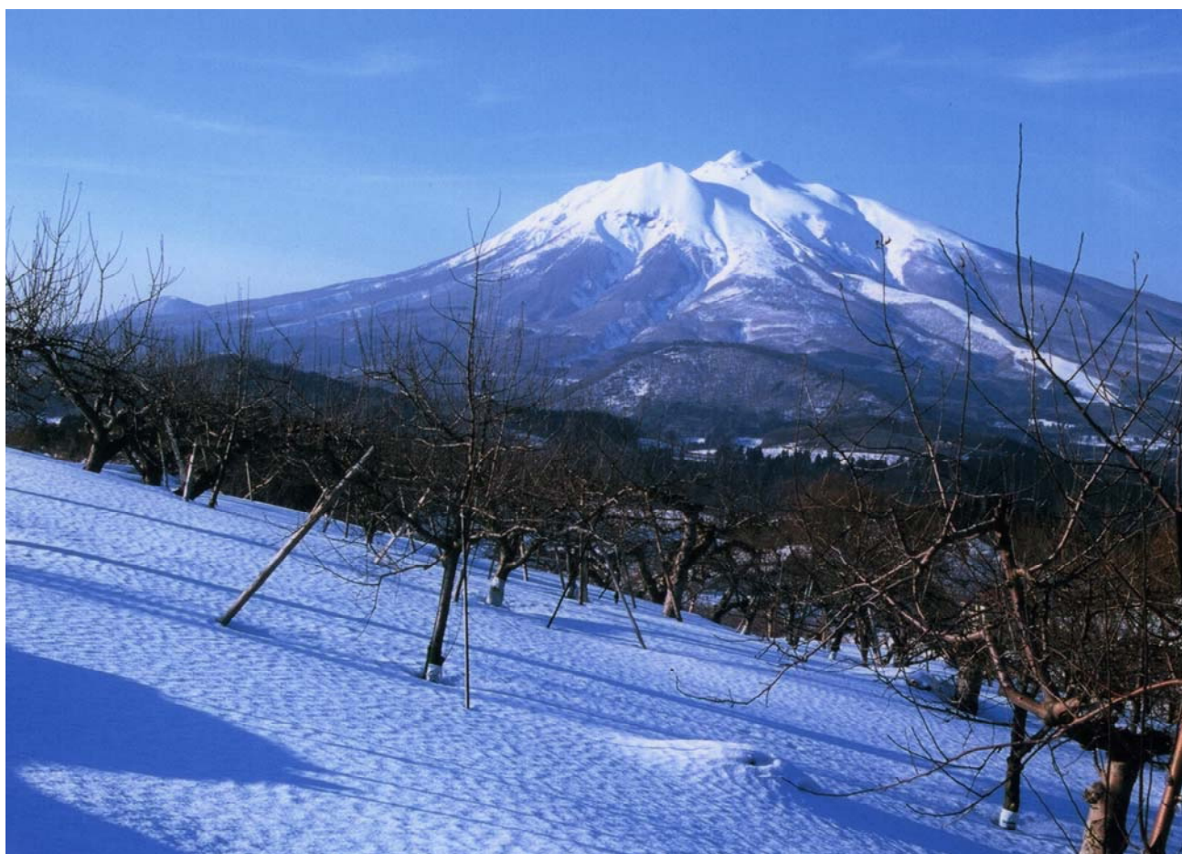
リンゴ園より望む冬の岩木山